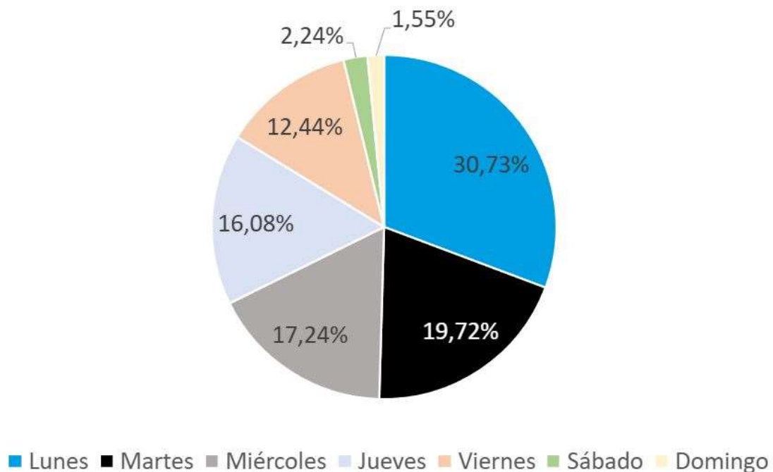
Tabla Bajas por día de inicio de la baja

Por días de la semana, el 30,73% de las bajas se inician los lunes. Conforme avanza la semana laboral, el porcentaje disminuye hasta el viernes (12,44%). Los fines de semana apenas se inician el 3,79%.